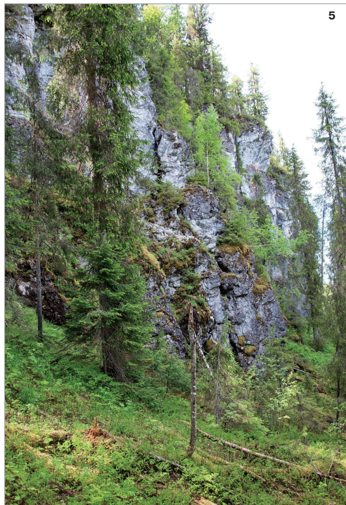
5. Карнизы скал – одно из местообитаний калипсо луковичной.

В заповеднике и на сопредельной территории вид редок. Известно всего несколько точек в предгорном районе: в окрестностях кордонов Шежым-Печорский и Собинская, где произрастает на карнизах по скалистым известняковым склонам коренных берегов, под пологом елового леса, ниже устья р. Большая Порожная, в еловом травяно-папоротничково-зеленомошном лесу, а также в бассейне р. Илыч на возвышенности Ляга-Чугра. В горном районе найдена довольно крупная популяция в ельнике зеленомошном на склоне горы Медвежий Камень.