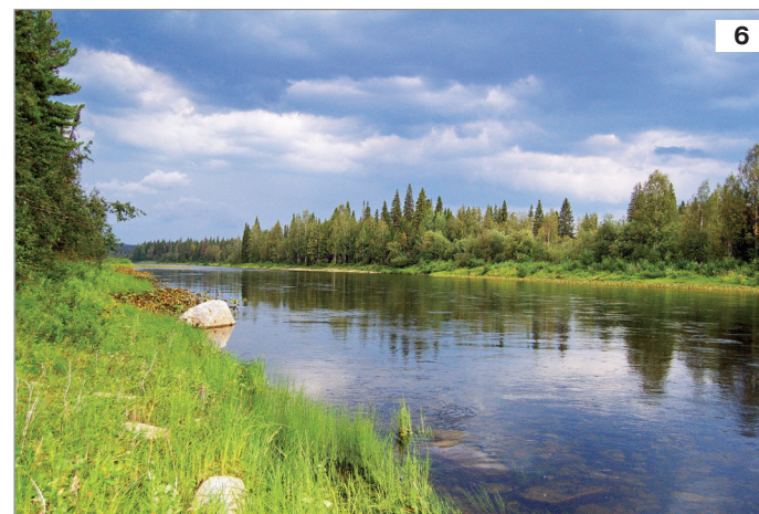
6. Пальчатокоренник Фукса часто растет на берегах рек (бечевниках).

В заповеднике вид произрастает во всех ландшафтных районах в самых разных местообитаниях: речных долинах на разнотравных лугах, травянистых бечевниках, на ключевых болотах, по береговым террасам и склонам, в лесах. В горном районе отмечен в подгольцовом и нижней части горно-тундрового пояса, растет в редколесьях, на горных лугах и ключевых болотах. Образует довольно крупные популяции. Размножается семенами. В одной коробочке содержится в среднем 2.6 тыс. мельчайших семян.