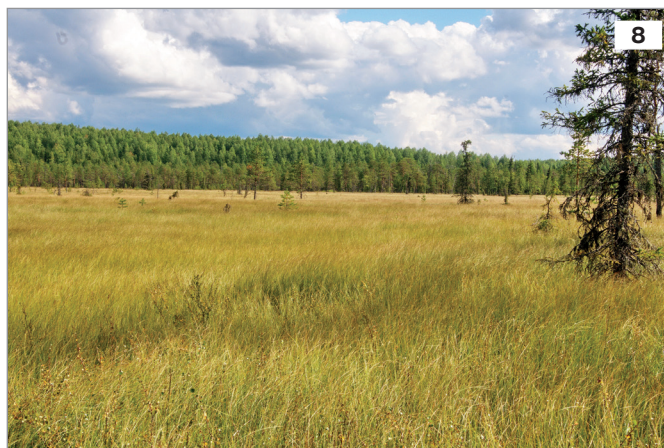
8. Типичное местообитание пальчатокоренника мясо-красного.