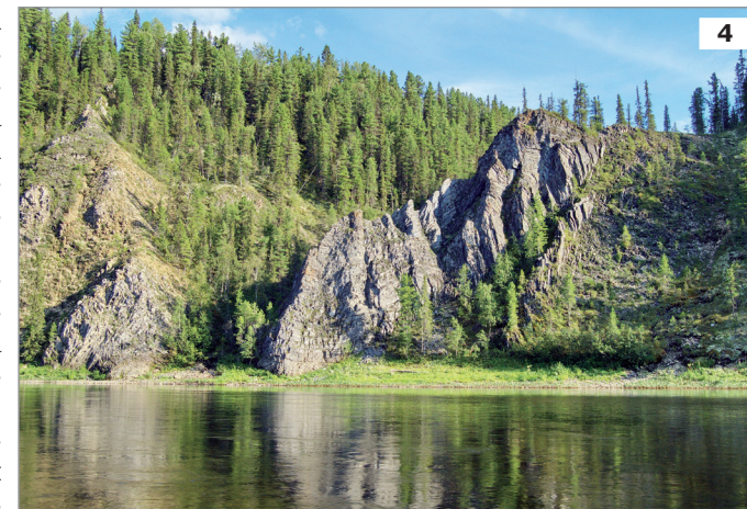
4. Скалы – типичные местообитания данного вида.

В Печоро-Илычском заповеднике вид редок, известно всего пять его местонахождений. В долине р. Илыч встречается на скалах Шантым-Прилук, в 3.0 и 4.5 км к северу от устья р. Ыджид-Ляга и на правом берегу р. Ыджид-Сотчемъель, произрастает на известняковых скалах под пологом елового и осиново-березового леса. Образует здесь довольно крупные популяции численностью до 500 побегов. Распространены растения отдельными куртинами, находящимися на некотором удалении друг от друга, насчитывающими от двух до 50 побегов. Небольшая популяция башмачка настоящего (13 побегов) обнаружена в долине р. Печора (в устье р. Большая Порожная) в разнотравно-сфагновом ельнике на окраине болота.