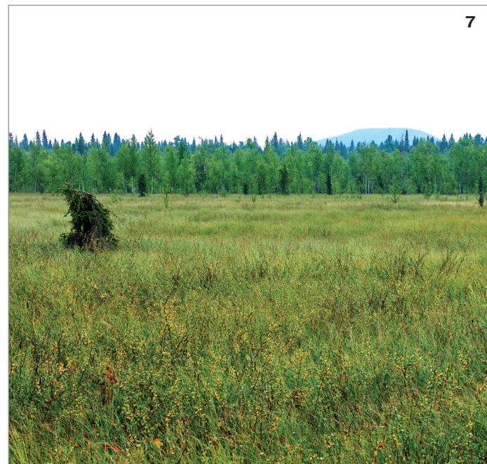
7. Пальчатокоренник кровавый произрастает на ключевых болотах предгорного района.

Очень редкий в заповеднике и его окрестностях вид, отмечен в двух точках предгорного района резервата. Довольно крупная популяция, насчитывающая сотни растений, расположена на правом берегу р. Печора, выше устья р. Большой Шежим на кустарничково-осоково-травяно-гипновом болоте. Одиночные растения обнаружены на левом берегу р. Печора напротив устья р. Большая Порожная на разнотравно-осоково-гипновом болоте.